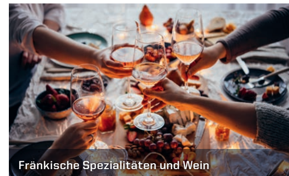
Fränkische Spezialitäten und Wein