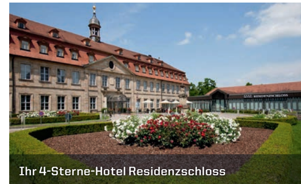
Ihr 4-Sterne-Hotel Residenzschloss