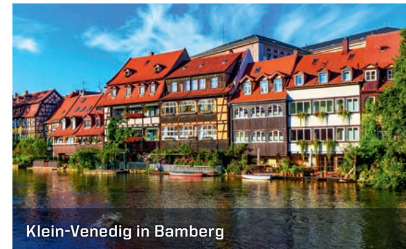
Klein-Venedig in Bamberg

Weinberge zieren zahlreiche, sonnenverwöhnte Hänge entlang des Mains, wo feinste Rebsorten angebaut und später zu einzigartigem Wein und Sekt verarbeitet werden. Franken wird auch die „Heimat der Biere“ genannt. Ein frisches fränkisches „Seidla Bier“, das satt-golden im Glas schimmert, ist für Kenner die Verheißung höchster Gaumenfreuden! Die Vielfalt der Sorten liegt hier fast schon in der Natur der Sache - schließlich wartet Franken mit der höchsten Brauereidichte Europas auf Sie. Lassen Sie sich vom fränkischen Charme in den kleinen Fachwerkstädtchen begeistern!