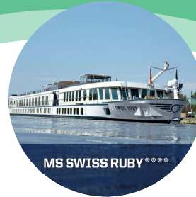
MS SWISS RUBY****