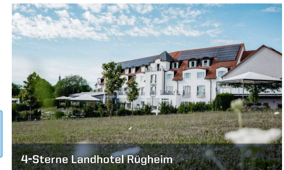
4-Sterne Landhotel Rügheim