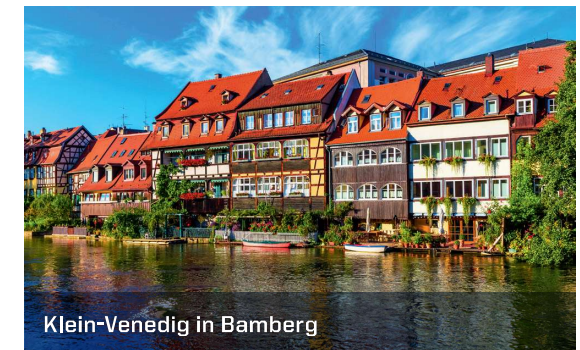
Klein-Venedig in Bamberg

Kundenservice: Telefon 04 91 / 97 90 200 www.ozezeitung.de